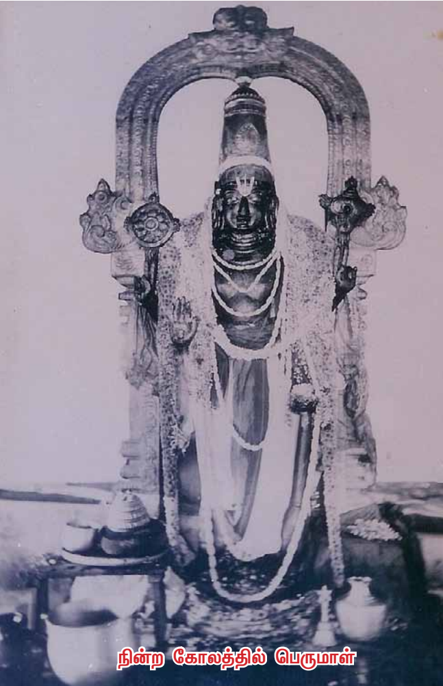
நிற்ற கோலத்தில் பெருமாள்

ஒவ்வொருவரின் இமெயில் முகவரியை தேடி வரும்