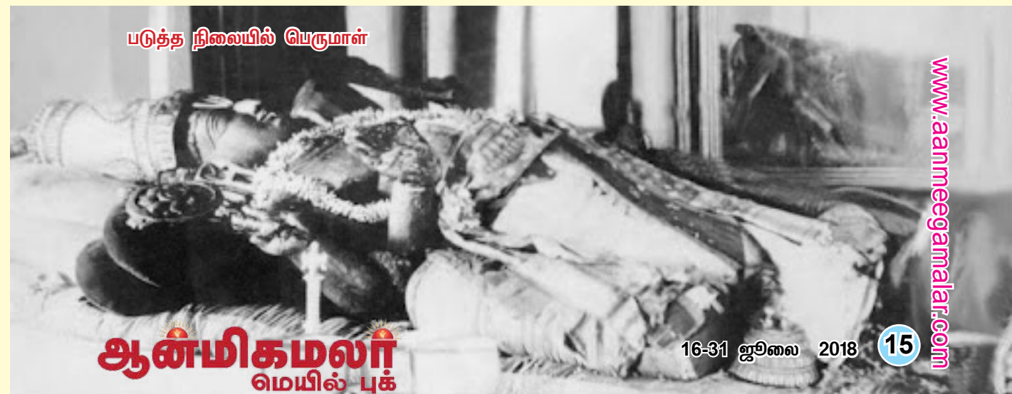
ஆன்மிகமலர் மெயில் புக