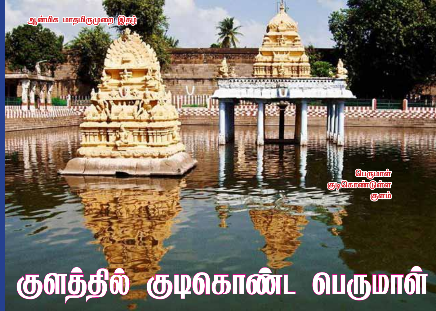
பெருமாள் குடிக்கொண்டுள்ள குளம்