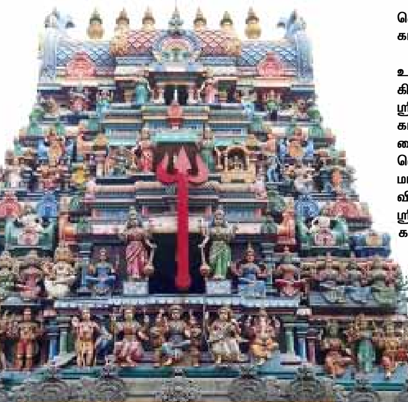
சென்னை ஸ்ரீ காளிகாம்பாள் வட்டிக் கர்த்தி தேவதா ம் ஸ்ரீ கிரீட லிங்க ருபிரம்மிய நமஸு

களும் அன்னை காளிகாம்பாளை வழிபட்டு பூர்வ ஜென்ம புண்ணியங்களை அடைந்தனர்.